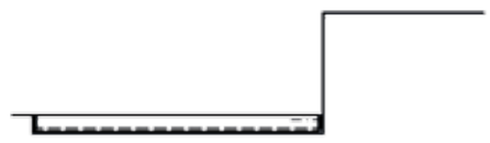
PLATE-FORME FERMÉE AU REPOS MACCHINA CHIUSA A RIPOSO

LEVER LES PROTECTIONS LATÉRALES SI ALZANO LE PROTEZIONI PERIMETRALI